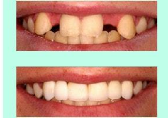
المنظر شبه الطبيعي لقواطع جانبية مسندة بزرعات سنية

✕ طريقة التلطف والاصوات ومخارجها هي الاخرى تنجز بشكل اسهل واسرع عند التعويض بالزرعات السنية (خاصةً عند تعويض القواطع الامامية) ، في حين اذا ما قورنت النتائج مع طقم اسنان متحرك لتعويض نفس تلك الاسنان المفقودة فإن الامر سيتطلب فترة طويلة نسبيا (قد تصل لبضعة اسابيع) حتى تتأقلم الانسجة الفموية المتعلقة باللفظ كاللسان والشفتان وحتى اللثة على الجهاز الكبير نسبيا.