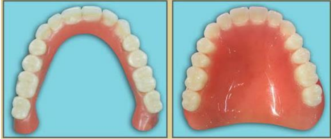
طقم علوي مدعم بزرعات سنية (الشكل الى اليسار)

٤. الاطعم المدعمة بالزرعات تساعد المريض على مضغ الطعام بفاعلية اكبر والتحدث بوضوح اعلى حينما تقارن بالاطعم الكاملة المدعمة مباشرةً بالفكين (الحرف الادردي).