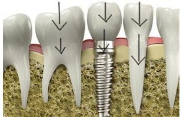
الزرعة السنية تنقل القوى مباشرة لعظم الفك

✘ احدى اهم الاهداف لبعض المرضى حين تعويض اسنانهم هو استعادة الجمالية والشكل الطبيعي لأسنانهم المفقودة، عند النظر الى تركيبية صناعية مثبتة على زرعة سنية فإن المنظر الطبيعي والجميل يكون متفوق على باقي الاساليب التقليدية للتعويضات السنية. فالسن المعوض بزرعة سنية عادةً ما يماثل السن الطبيعي من حيث الشكل، الاحساس، التطابق والوظيفة.